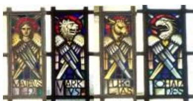
Die vier Evangelisten in den Kirchenfenstern

Aufgrund der besseren Lesbarkeit wird im Text das generische Maskulinum verwendet. Gemeint sind jedoch immer alle Geschlechter.