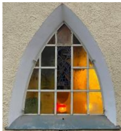
Fenster von außen des Evangelisten Johannes an Heilig Abend — Friedenskirche Peißenberg