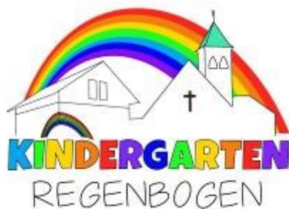
Neues Logo von M. Gräfenhahn

Mit Blick auf das Gruppenbild sind Sie vermutlich erstmal überrascht, wie groß das Team geworden ist. Ganz bewusst wollten und wollen wir das Miteinander in der Kirchengemeinde stärken! So wurde heuer neben Angestellten erstmalig auch der gesamte Kirchenvorstand zum Betriebsausflug eingeladen. Wir begannen mit einem gemeinsamen Mittagessen im Gemeindehaus. Nach einem lustigen Ratespiel mit Erklärungen, Pantomime und Ein-Wort-Erklärungen fuhr wir auf den Hohen Peißenberg. Dort erwartete uns bei strahlendem Sonnenschein eine Führung im meteorologischen Ob-