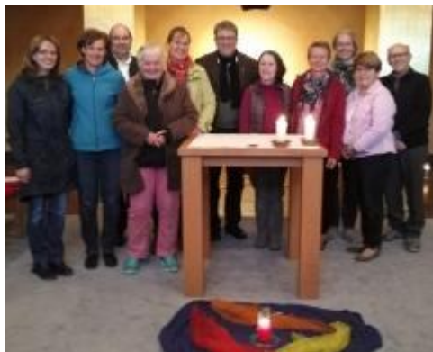
Teil der Gruppe

Das ist der Titel unserer Ökumenischen Exerzitien 2026. „Halt an, wo läufst du hin? Der Himmel ist in dir. Suchst du Gott anderswo, du fehlst ihn für und für.“ Dieses Thema begleitet dann die Gruppe über vier Wochen. In dieser Zeit gibt es wöchentlich ein Treffen zum Austausch. Die restliche Zeit ist zur freien