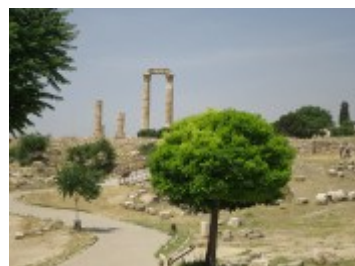
Alle Fotos von unserer Reise 2016